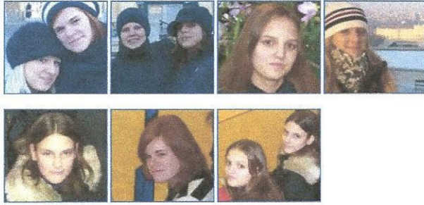
fkc.hu Fotó: Dancs Nóra & Co.

© 2009 FEHÉRVÁRI KÉZILABDA CLUB - MINDEN JOG FENNTARTVA.